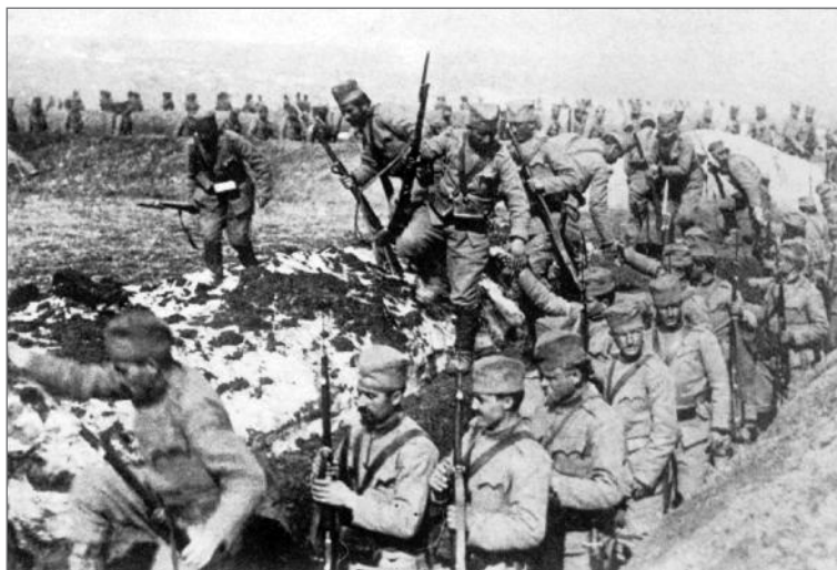
Srpska pešadija izlazi iz rovova tokom operacija u 1914. godini kako bi napali austrougarske položaje. Vojnici nose standardne uniforme M 1908, opanke i nemačku smeđu kožnu opremu M 1895, sa ukrštenim uprtačima što je bilo svojstveno Srbima.

koji je bio deo Zajedničke armije, i Pomorski vazdušni korpus ( Seefleigerkorps ) su operisali na zapadnom Balkanu.